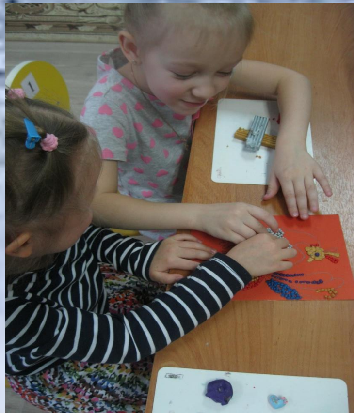
На занятии по пластилинографии (пластилиновая мозаика «Жар-птица»)