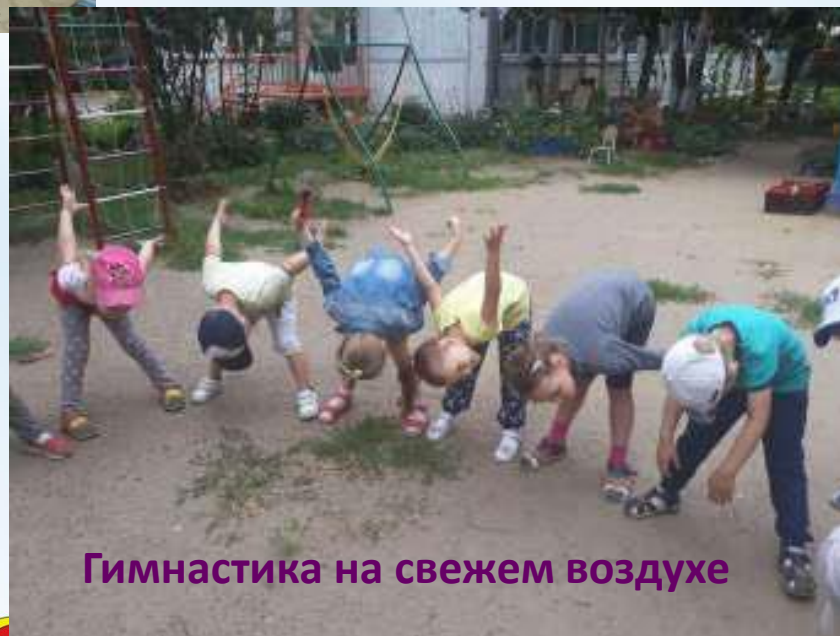
Гимнастика на свежем воздухе