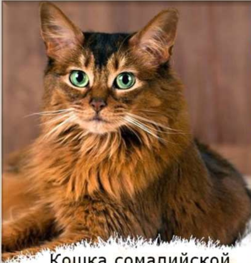
Кошка сомалийской породы