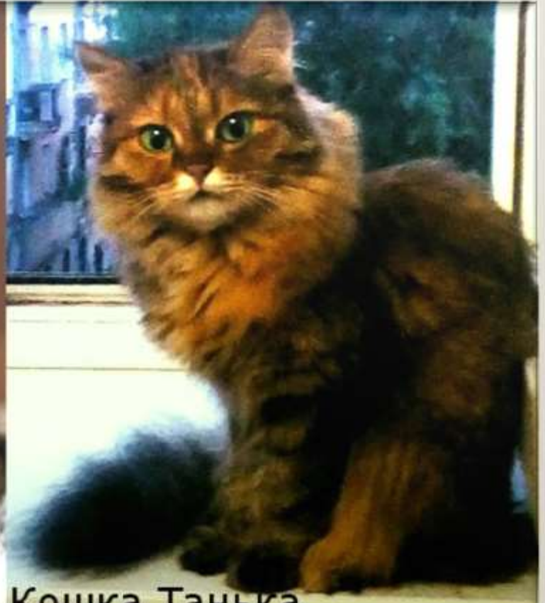
Кошка Танька (Красноярский край)