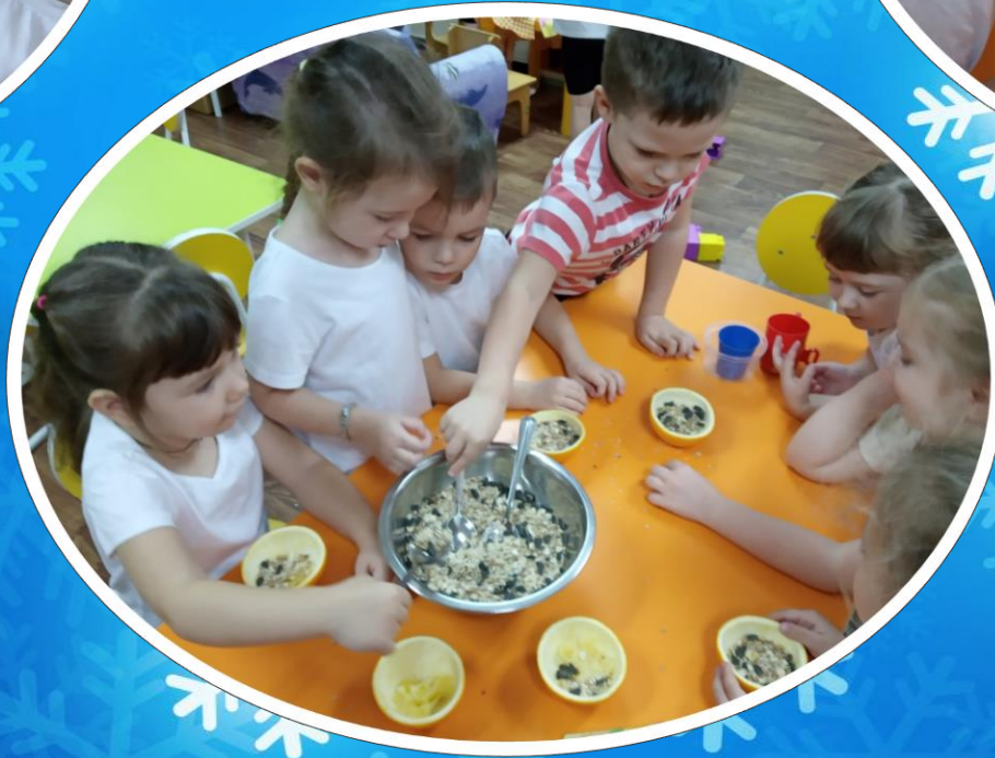
Разложить сухую смесь по апельсиновым чашечкам