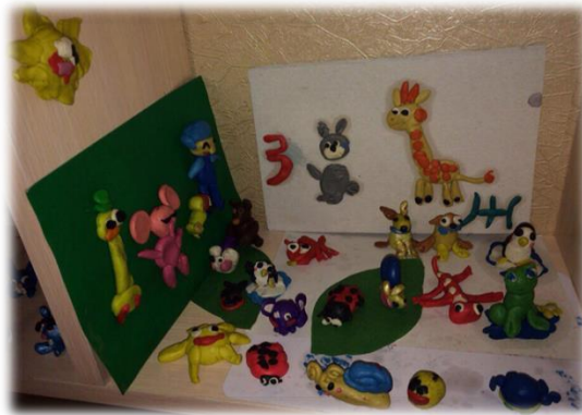
Работа с психологом и волонтерами