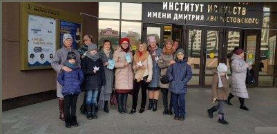
Коллективный просмотр спектакля «Последний поклон» по повести В.П.Астафьева