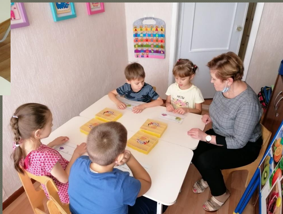
Работа в подгруппе