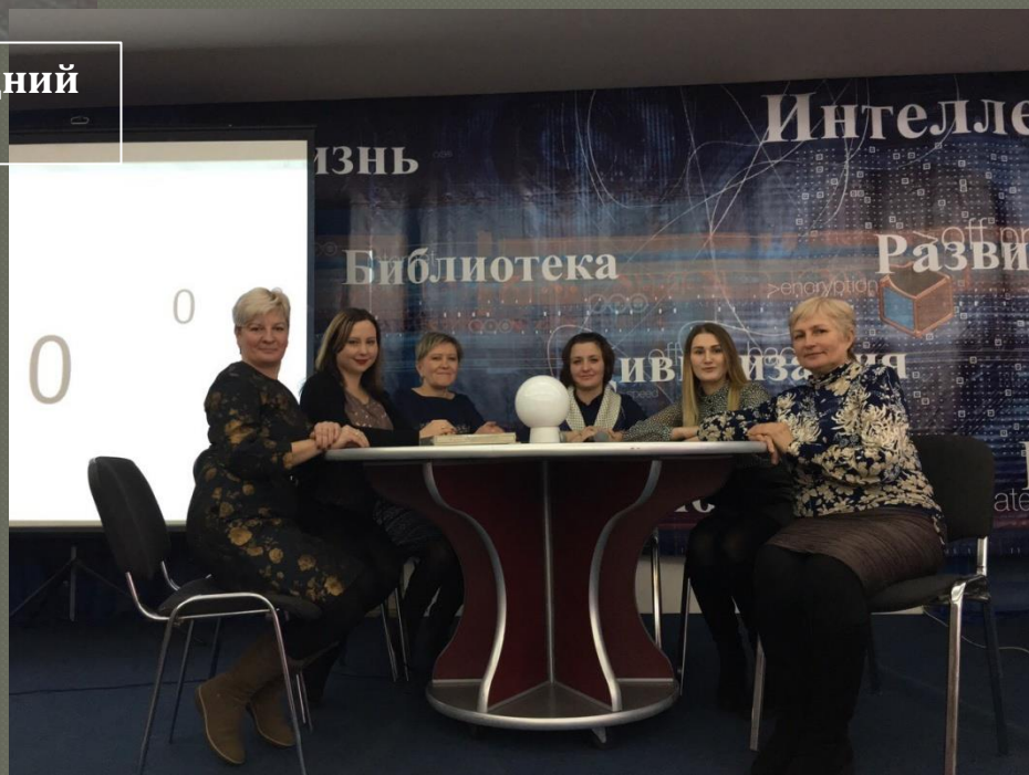
Районный этап игры «КВИС»