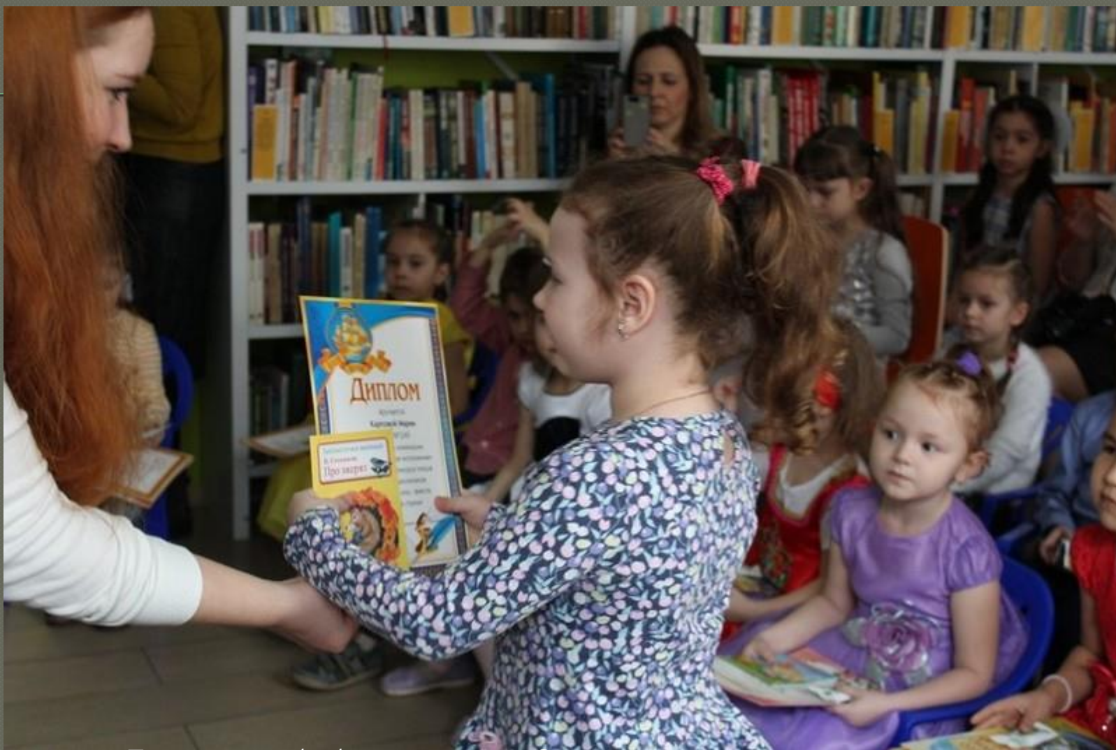
Городская библиотека им. Островского – вручение диплома за победу в городском конкурсе чтецов.