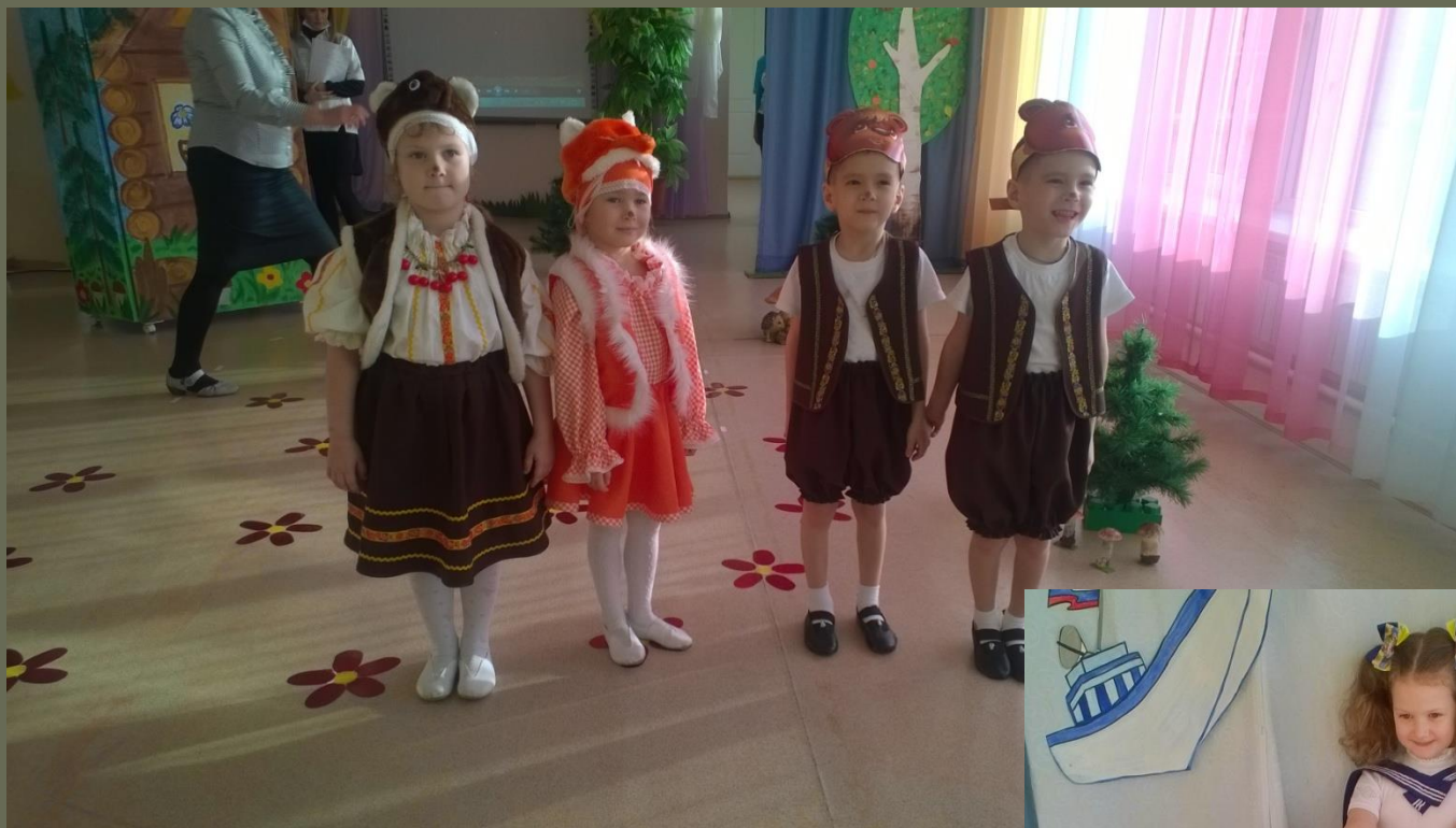
Исполнители главных ролей в спектакле «Два жадных медвежонка»