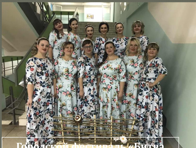
Городской фестиваль «Битва хоров»