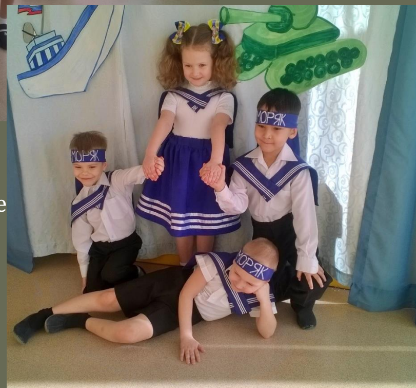
Номер на день Защитников Отечества