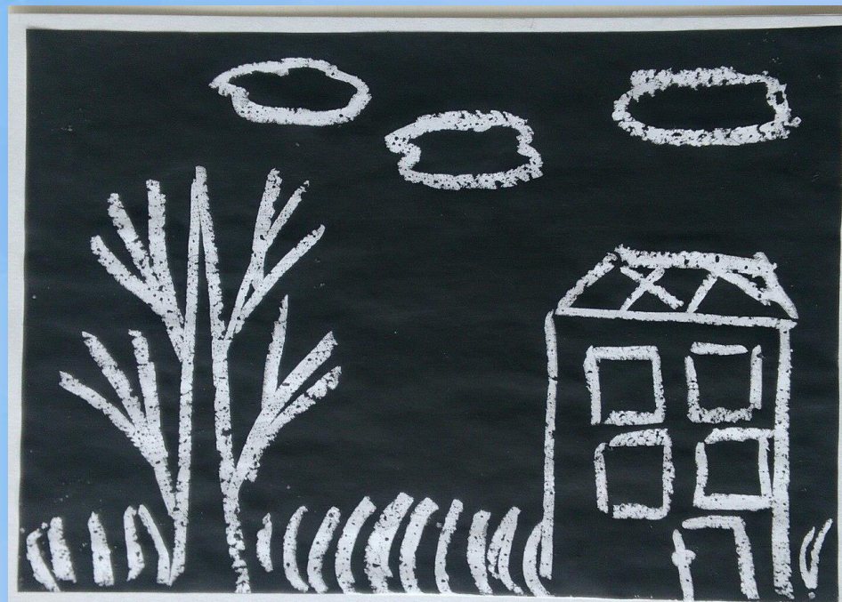
Рисунок свечой остаётся белым.

Способ получения изображения: ребёнок рисует свечой на бумаге. Затем закрашивает лист акварелью в один или несколько цветов.