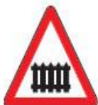
1.1 Железнодорожный переезд со шлагбаумом