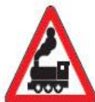
1.2 Железнодорожный переезд без шлагбаума