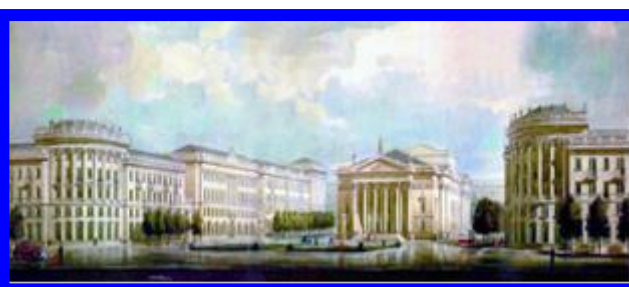
Улица Ленина давным - давно и в наши дни

В старшей группе знания о городе, полученные детьми в средней группе, закрепляются и дополняются. Моя задача – с самых ранних лет заложить в детях интерес к истории нашего города, воспитать чувство уважения, гордость за свой город, желание сделать ее лучше. Я стремлюсь показать своим воспитанникам, что наш город славен своей историей, традициями, достопримечательностями, памятниками.