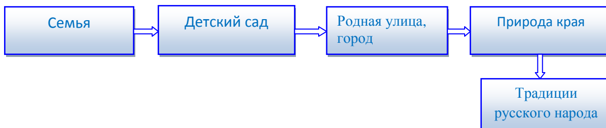
Схема работы по нравственно-патриотическому воспитанию дошкольников