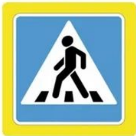
Наземный пешеходный переход