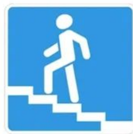
Надземный пешеходный переход