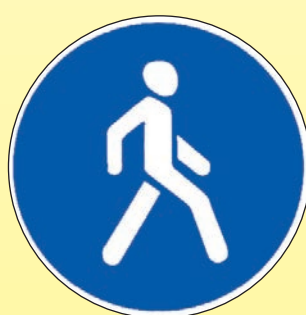
4.5.1 «Пешеходная дорожка»