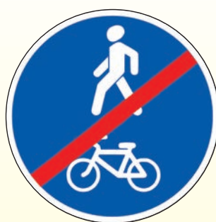
4.5.3. «Конец пешеходной и велосипедной дорожки с совмещенным движением»