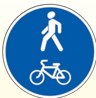
4.5.2. «Пешеходная и велосипедная дорожка с совмещенным движением (велопешеходная дорожка с совмещенным движением)»