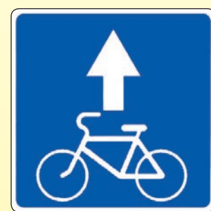
5.14.2. «Полоса для велосипедистов»