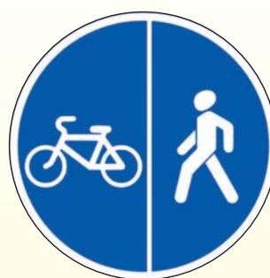
4.5.4. «Пешеходная и велосипедная дорожки с разделением движения»