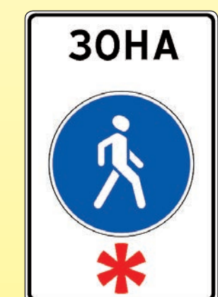
5.33 «Пешеходная зона»