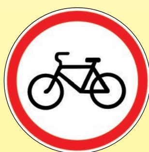
3.9 «Движение на велосипедах запрещено»