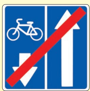
5.12.2. «Конец дороги с полосой для велосипедистов»