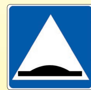
5.20. «Искусственная неровность»