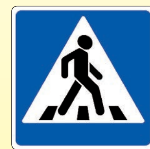
5.19.1. «Пешеходный переход»