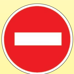
3.1 «Въезд запрещён»