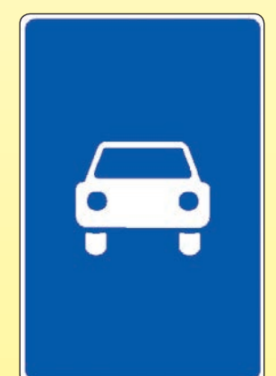
5.3 «Дорога для автомобилей»