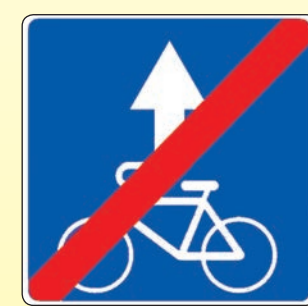
5.14.3. «Конец полосы для велосипедистов»