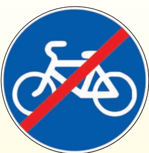
4.4.2. «Конец велосипедной дорожки или полосы для велосипедистов»