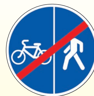
4.5.6. «Конец пешеходной и велосипедной дорожки с разделением движения (конец велопешеходной дорожки с разделением движения)»