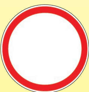
3.2 «Движение запрещено»