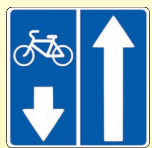
5.11.2. «Дорога с полосой для велосипедистов»