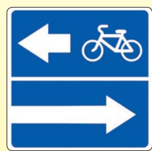
5.13.3. «Выезд на дорогу с полосой для велосипедистов»