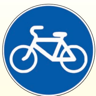
4.4.1. «Велосипедная дорожка»