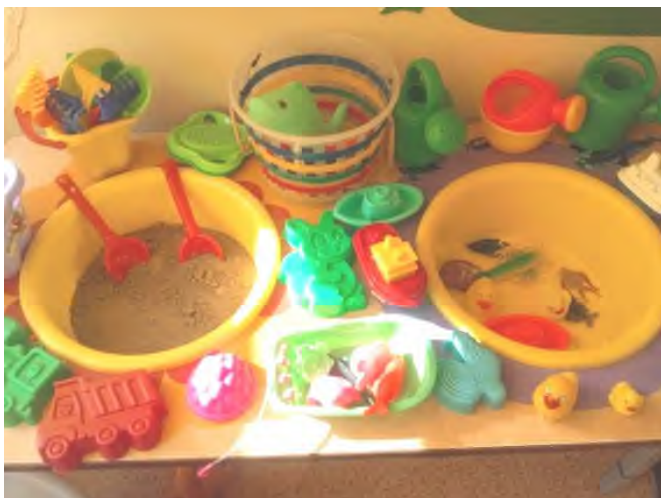
Игры с песком и водой.

Центр игровой деятельности для сюжетно-ролевых и режиссерских игр (театрализованная деятельность, ряжение, освоение социальных ролей и профессий и пр.) для настольно-печатных и развивающих игр (рассматривание иллюстрированного материала, дидактические игры и пр.);