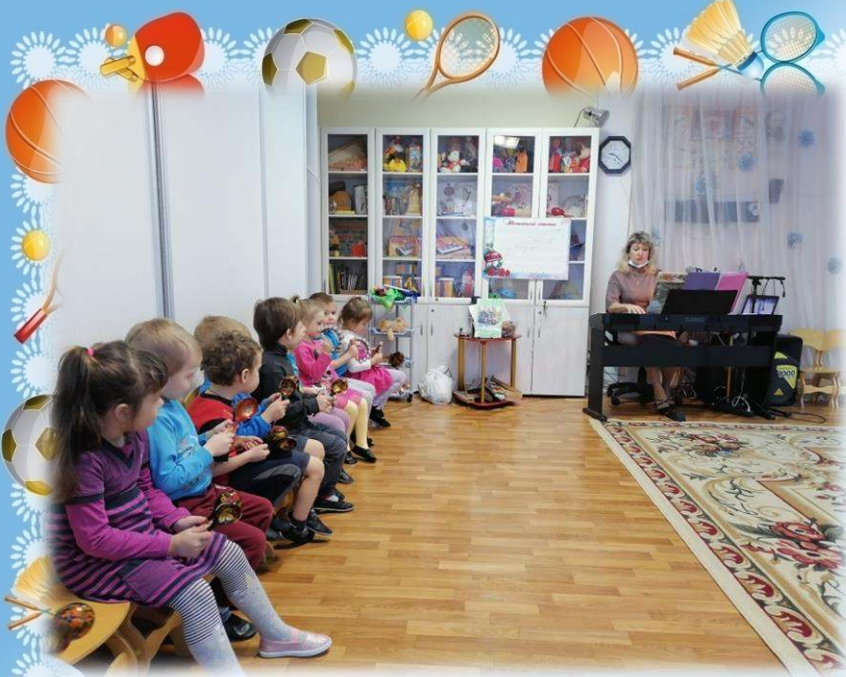
Играли на музыкальных инструментах – ложках и бубенцах