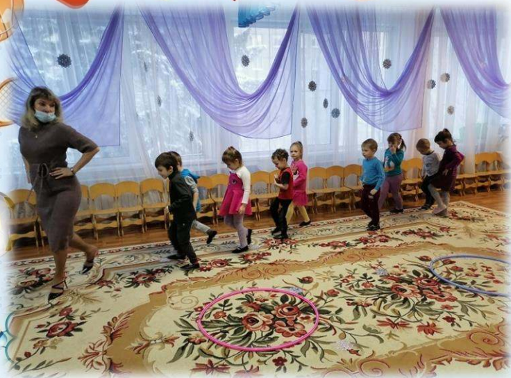
На музыкальном занятии под музыку «катались на коньках»