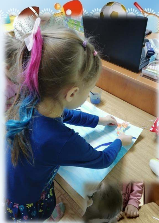
Делали коллаж «Зимние виды спорта»