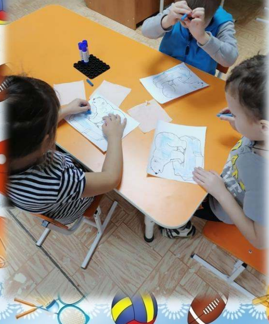
Делали аппликацию «Белый мишка»