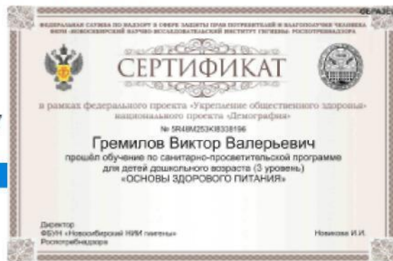
Рис. 15. – Просмотр результатов итогового тестирования и получение сертификата, подтверждающего успешность прохождения обучения

В случае если набрано менее 80% правильных ответов, Программа указывает проблемные разделы и предлагает пройти тестирование повторно. Количество повторных тестирований не ограничено по количеству, но ограничено по времени. Повторное тестирование можно пройти не ранее чем через 24 часа от предыдущего тестирования.