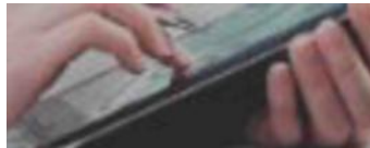
Рис. 1. – Баннер «Обучение по санитарно-просветительским программам - основы здорового питания»

Для процедуры регистрации необходимо нажать кнопку «Регистрация в ПС – обучение по программам основы здорового питания» (рис. 2).