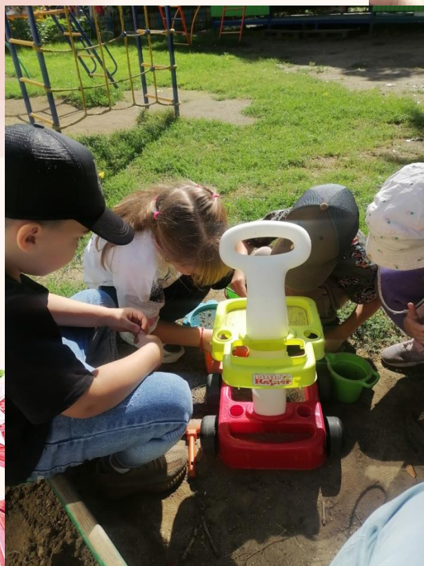
Наблюдали за жизнью муравьев