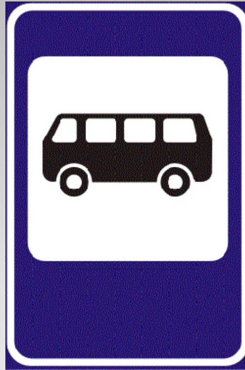
Место остановки автобуса

ЭТОТ ЗНАК УКАЗЫВАЕТ НА ОСТАНОВКУ АВТОБУСА