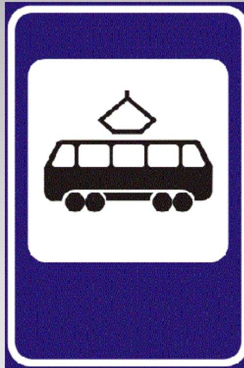
Место остановки трамвая

ЭТОТ ЗНАК НАХОДИТСЯ ОКОЛО ОСТАНОВКИ ТРАМВАЯ