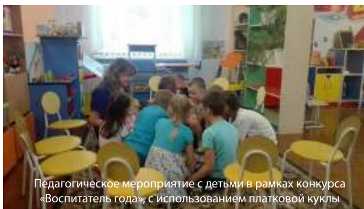
Педагогическое мероприятие с детьми в рамках конкурса «Воспитатель года», с использованием платковой куклы