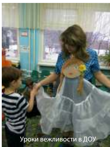
Уроки вежливости в ДОУ

Самодельная платковая кукла находит широкое применение в воспитательно-образовательной работе с детьми. Платковая кукла — это чудо-пособие, имеющее развивающее, обучающее и воспитательное значение. Эта кукла вызывает у детей восторг, восхищение, удивление, желание разговаривать с ней. Все, кто познакомится с платковой куклой, сразу поймут, как много радости принесет она детям и взрослым.