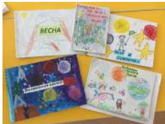
Рис.1. Книги детского издательства «Сам-издательство»

презентована студентам и преподавателям КГПУ им. В. П. Астафьева в рамках проведения Декадника науки «День детской книги».