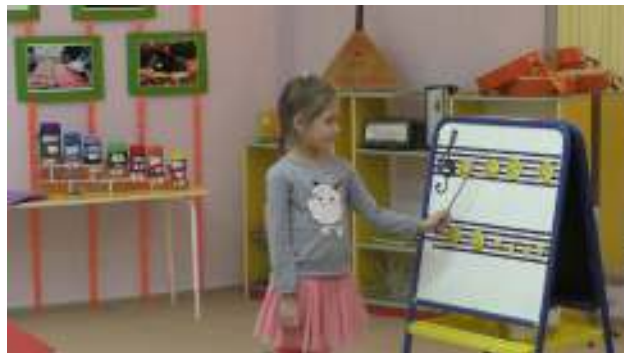
Фото 2. Занятия в музыкальной студии