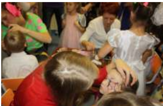
и акция «Мы помним! Мы гордимся!»