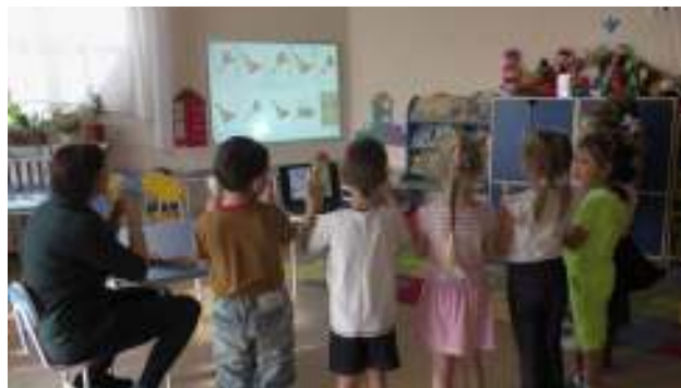
Фото 1. Использование готовых мультимедийных презентаций в групповом пространстве