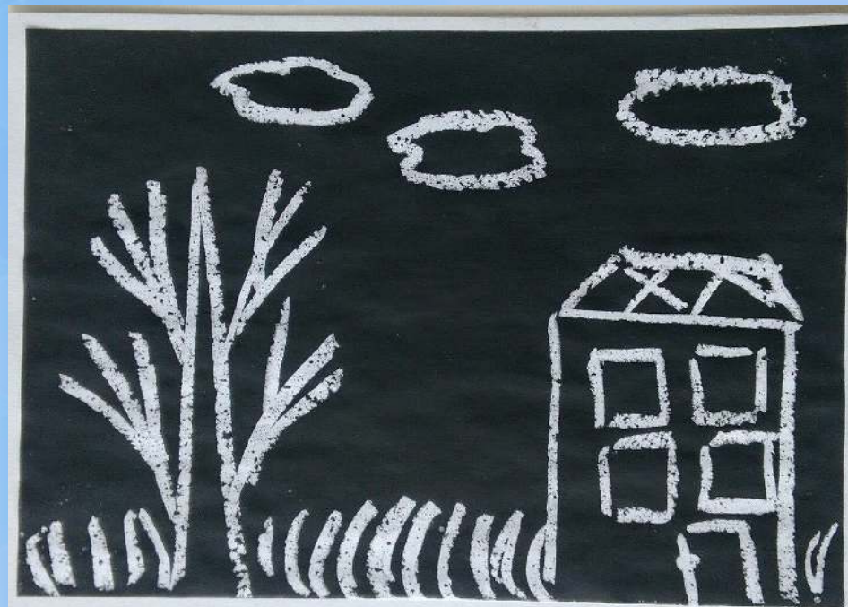
Рисунок свечой остаётся белым.

Способ получения изображения: ребёнок рисует свечой на бумаге. Затем закрашивает лист акварелью в один или несколько цветов.