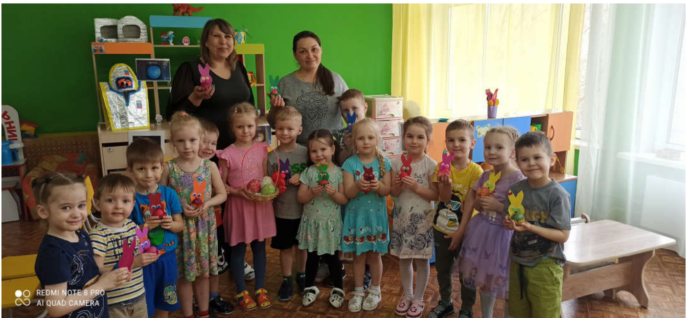
Вот такие у ребят получились красивые яркие пасхальные зайчики с яйцами.