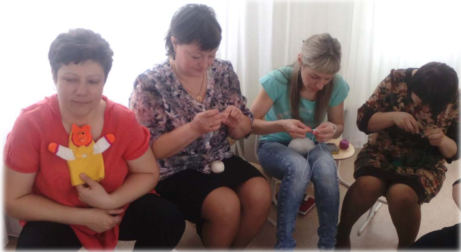
Клуб рукоделия (Изготовление дидактических пособий)