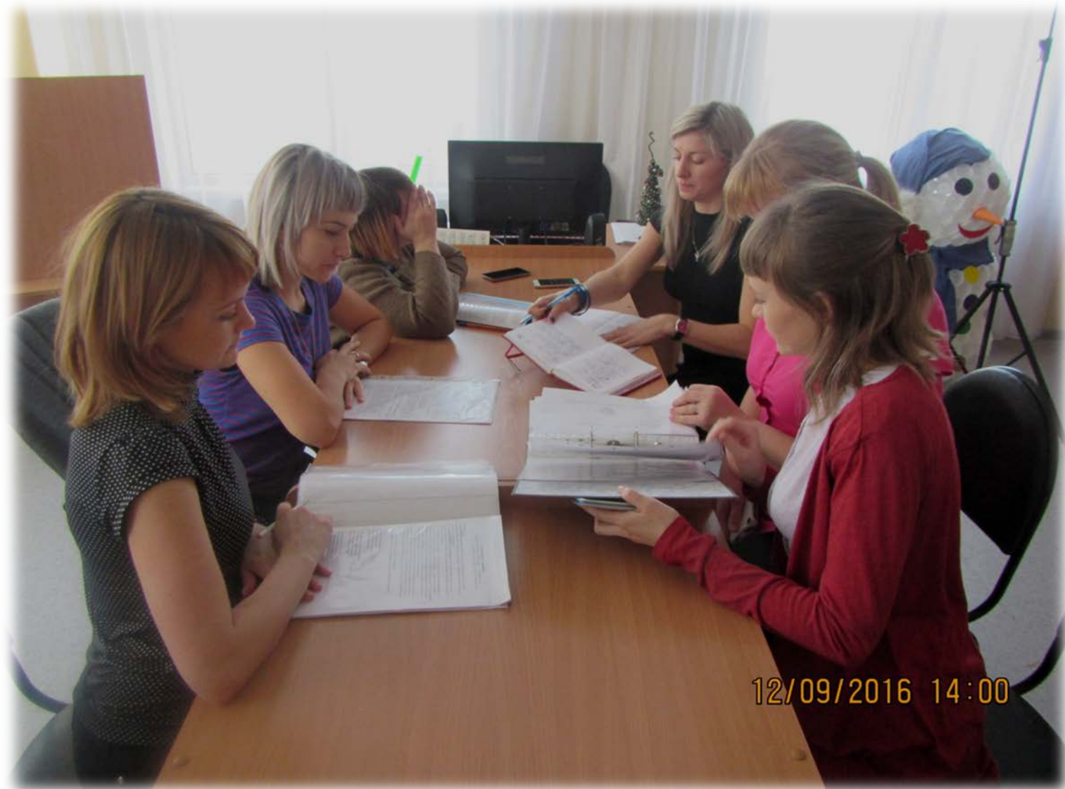
Рабочая зона для педагогов