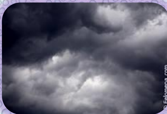
ОБЛАКИ ТУЧИ А