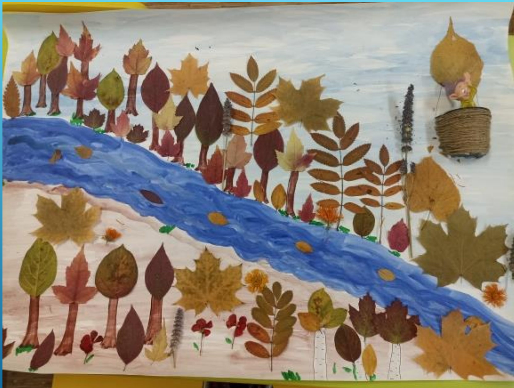
СОВМЕСТНАЯ РАБОТА «ПРОЩАЙ, КРАСАВИЦА - ОСЕНЬ»