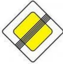
«Конец главной дороги»