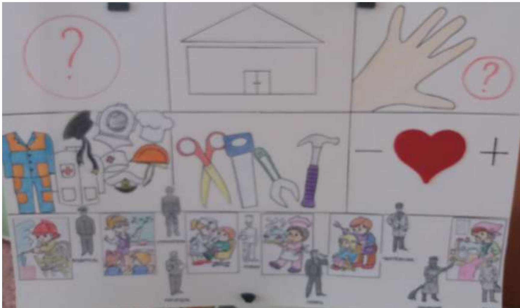
Схема для составления описательного рассказа по теме «Профессии»