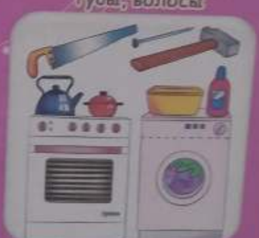
Занятия членов семьи