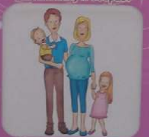
С кем я живу и за что ответственен