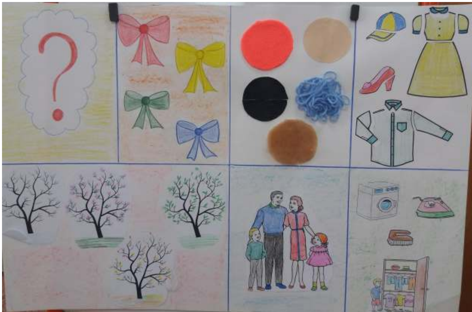
Схема для составления описательного рассказа по теме «Одежда»