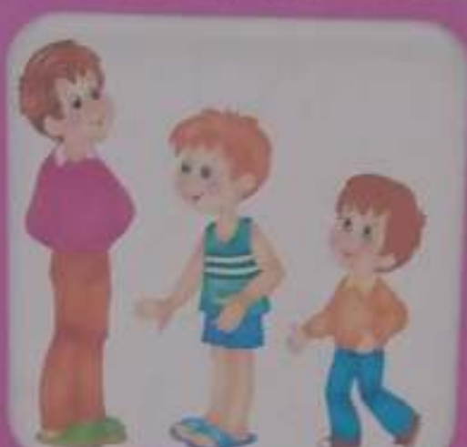
Рост (высокий, средний, маленький) и возраст