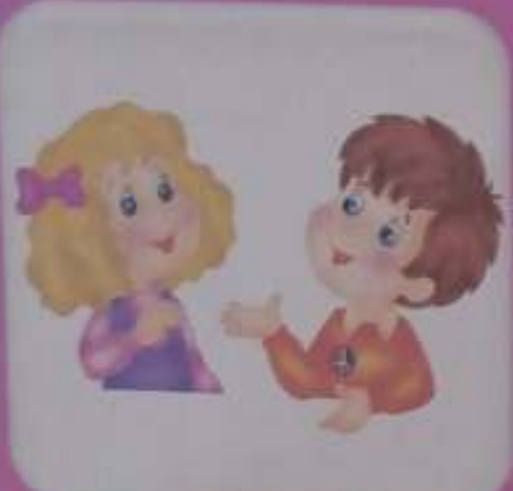
Мальчик или девочка, имя и фамилия