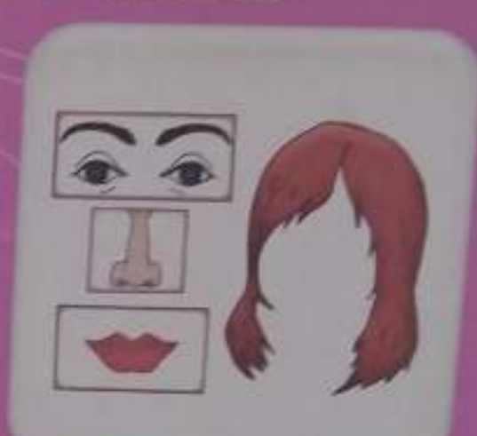
Глаза, брови, нос, губы, волосы