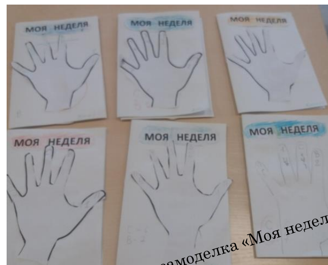
Книжка-самоделка «Моя неделя»