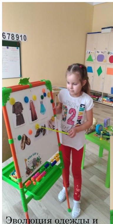
Эволюция одежды и обуви