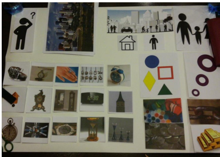
Мнемотаблица «Расскажи о часах»