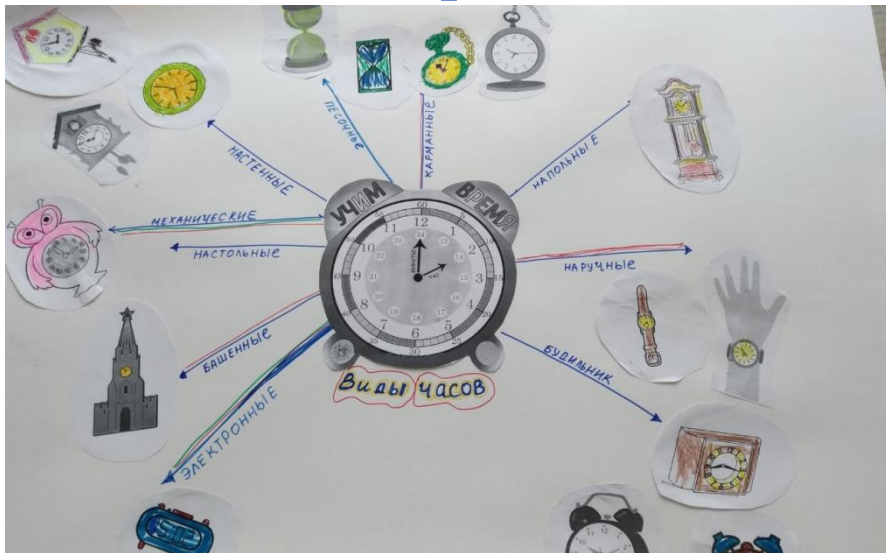
«Мыслительная паутинка «Виды часов»