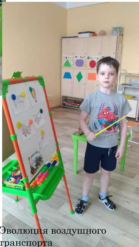
Эволюция воздушного транспорта