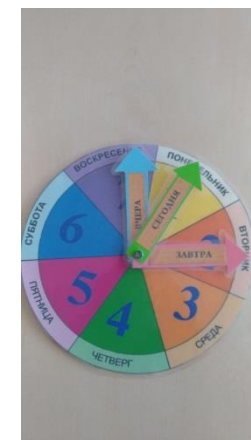
Игра-пособие «Вчера, сегодня, завтра»