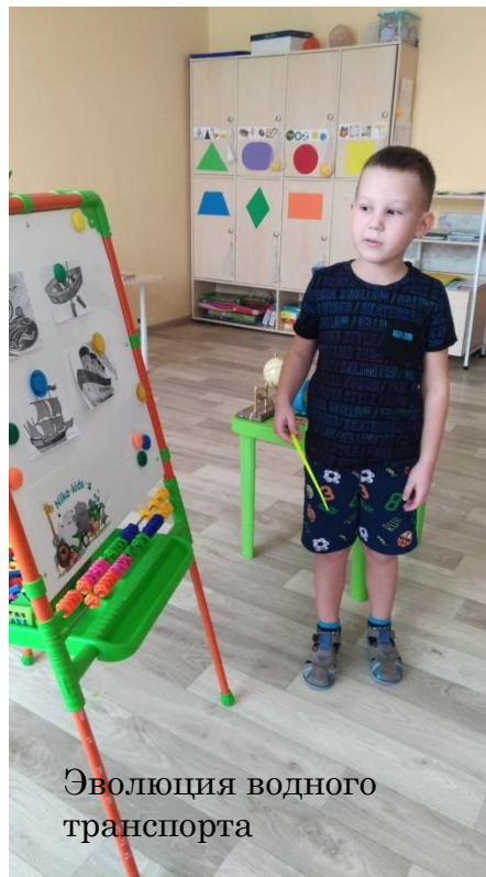
Эволюция водного транспорта