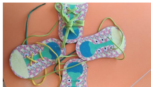
Дидактические игры «Одежда, обувь, головные уборы»