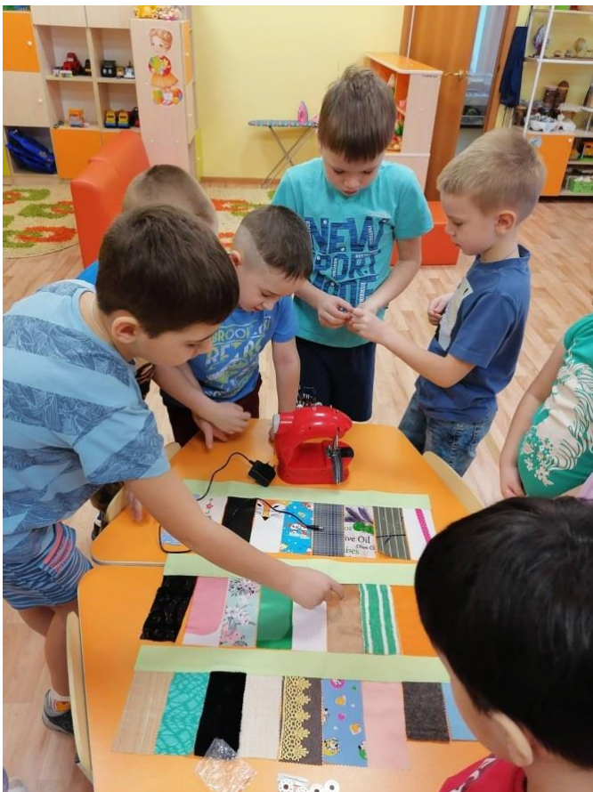
Сюжетно-ролевая игра «Ателье»

тема недели «Одежда, обувь, головные уборы»