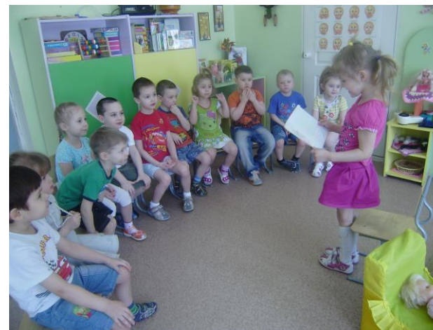
Представление результатов исследования по теме: «Где живет водичка?» воспитанницей группы.