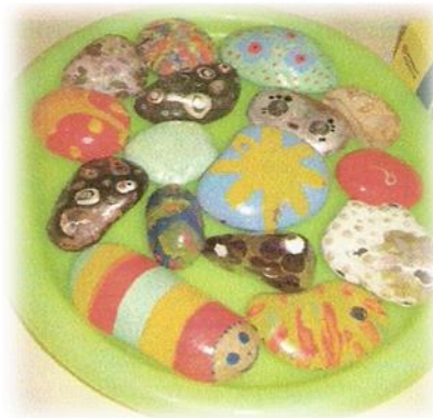
рисунок 1.2 рисунок 1.3