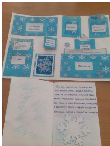
Презентационные работы по теме: «Волшебная снежинка» воспитанников группы