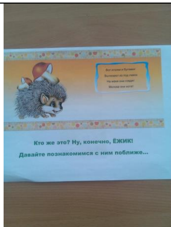
Презентация опыта семейного мини-проекта по теме: «Ежик, ежик колкий покажи иголки»