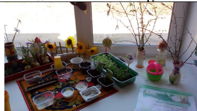
Ход реализации исследовательского проекта по теме: «От семечки до семечки»