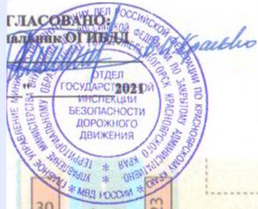
Схема безопасного маршрута движения до МБДОУ №24 «Орленок»

УТВЕРЖДАЮ: Заведующий МБДОУ № 24 «Орленок» Подпись: Савилов О.Е. Давыденко