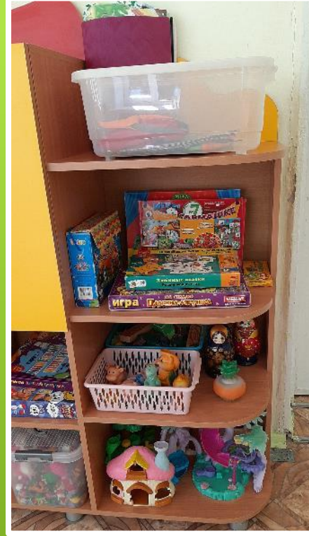
«Центр театра и музыки»