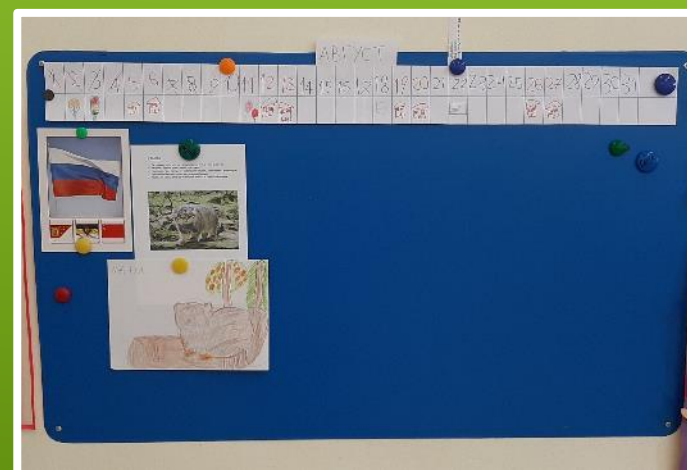
Презентация детьми «Редкие животные Красноярского края»