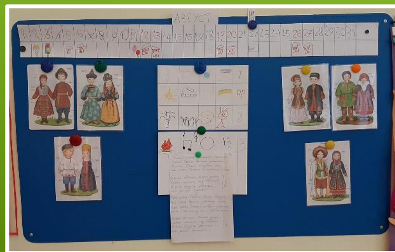
Разучивали песню «У моей России длинные косички» (используя мнемотехнику)