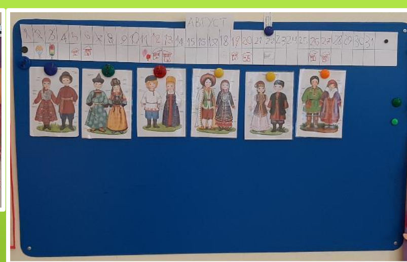
Беседа: «Костюмы народов России»