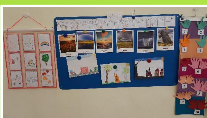
Повторили признаки лета