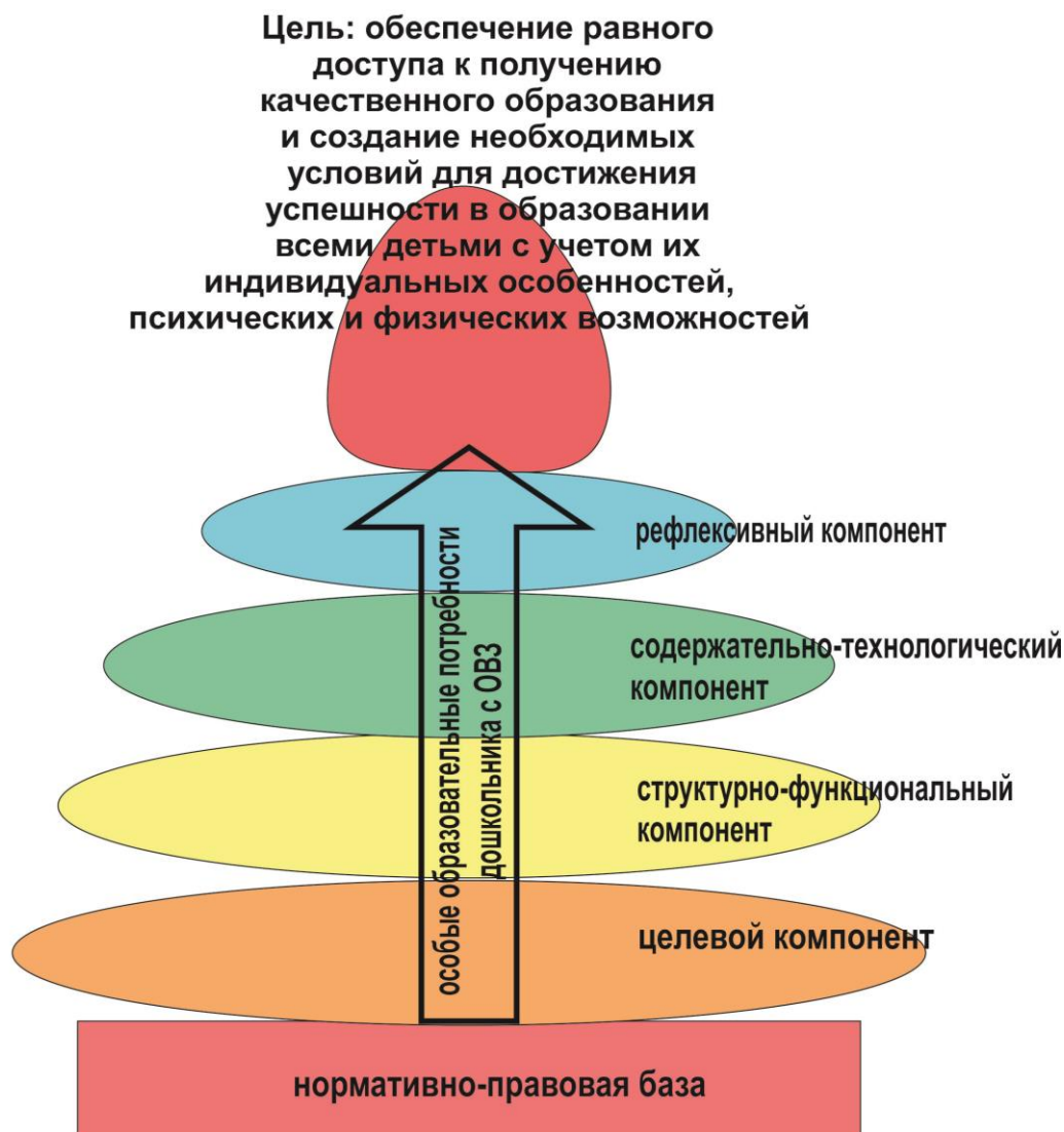
предметная модель инклюзивного образования в МБДОУ № 37 “Теремок”

Цель инклюзивного образования: обеспечение равного доступа к получению качественного образования и создание необходимых условий для достижения успешности в образовании всеми детьми с учетом их индивидуальных особенностей, психических и физических возможностей.