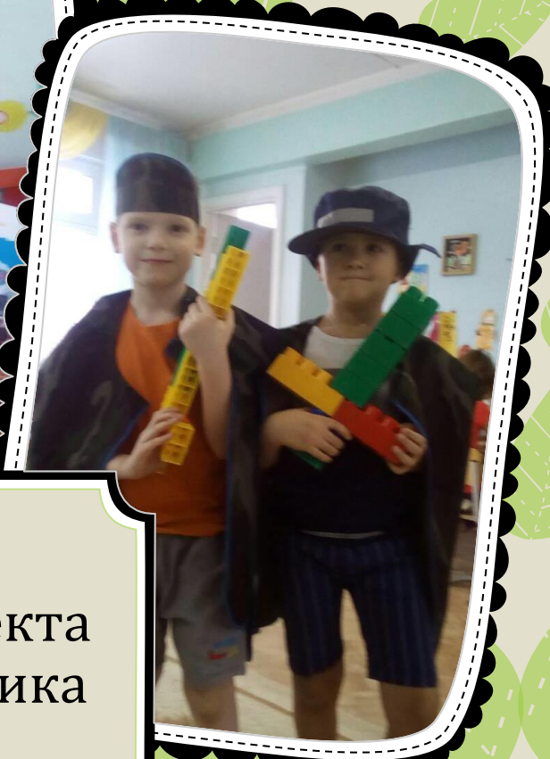
Создание проекта «День защитника отечества»