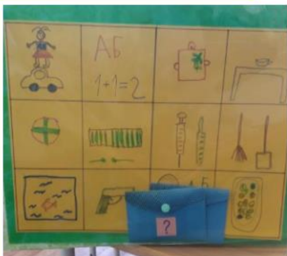
Дидактическая игра «Профессии детского сада», сделанная руками детей