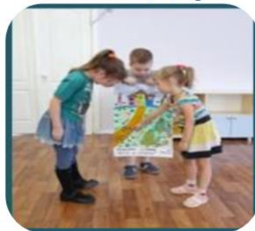
Презентация афиши к сказке