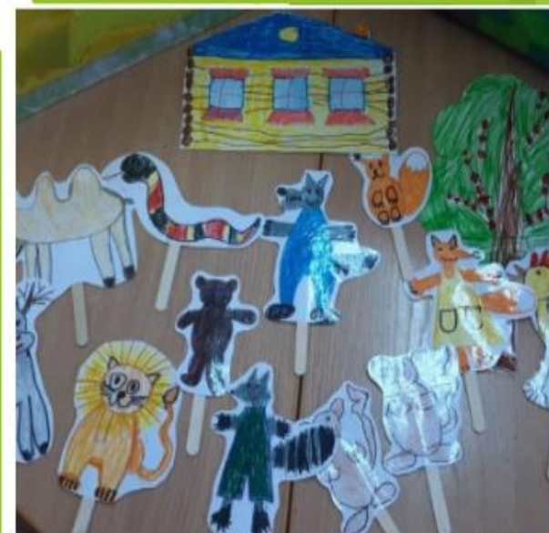
Персонажи животных для игры в театр, сделанные руками детей