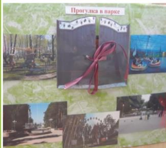
Фоторепортаж «Экскурсия по парку нашего города с посещением зоосада»