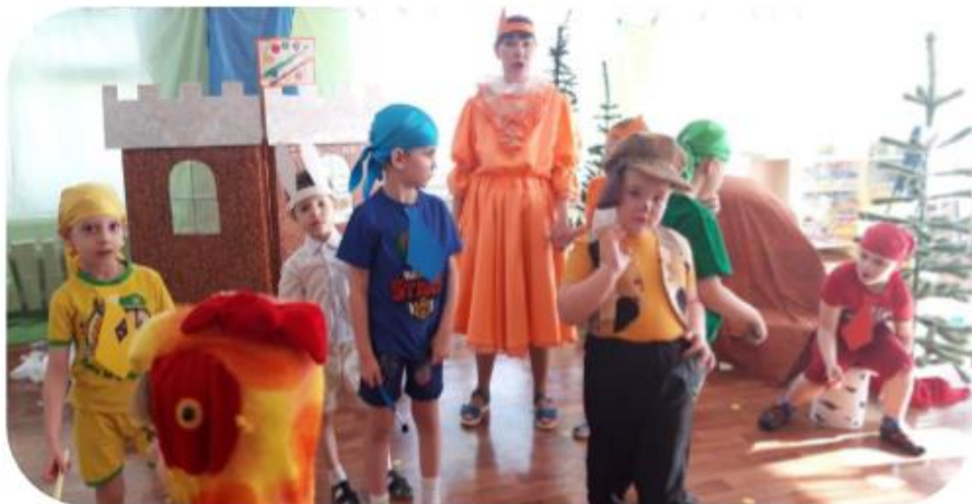
Готовимся к показу сказки «Петух и краски»