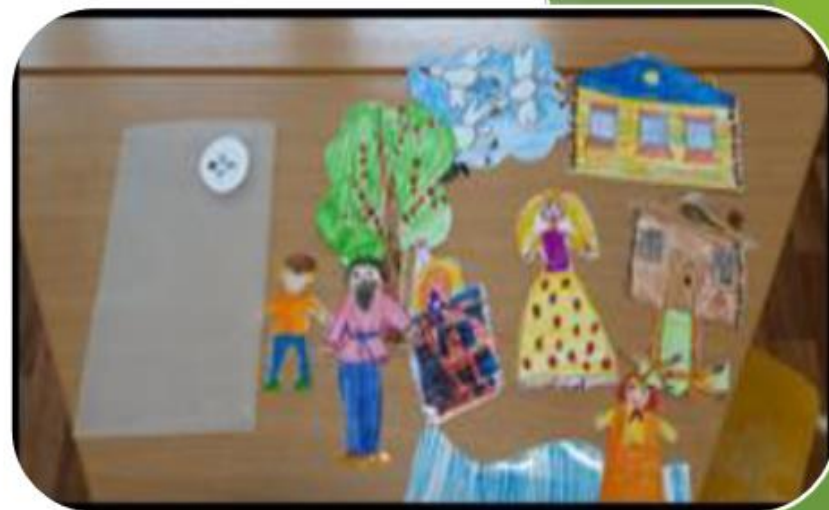
Рисуем свои сказки