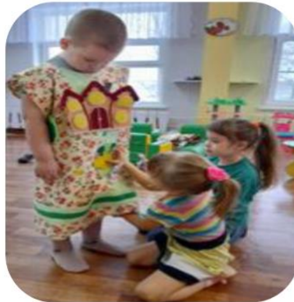
«Сказочный фартук» из фетра