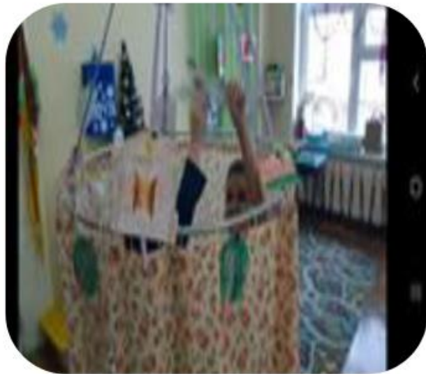
Ширма для показа сказки