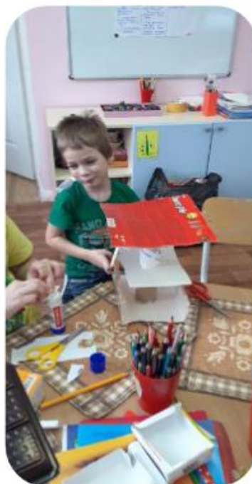
Делаем сказку из бросового материала