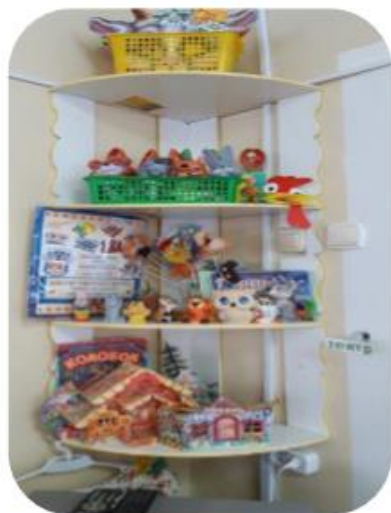
Разные виды театра