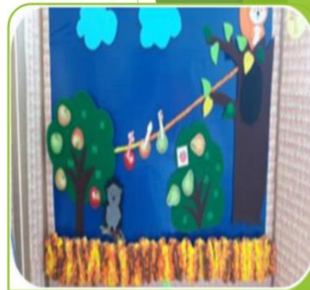
Обыгрывание сказки по собственному замыслу из фетра