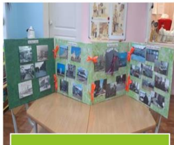
Познавательные странички города