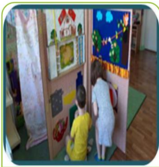
Дидактические игры на лэпбук