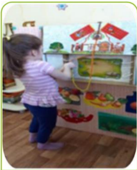
Расскажи сказку с помощью шнуровки