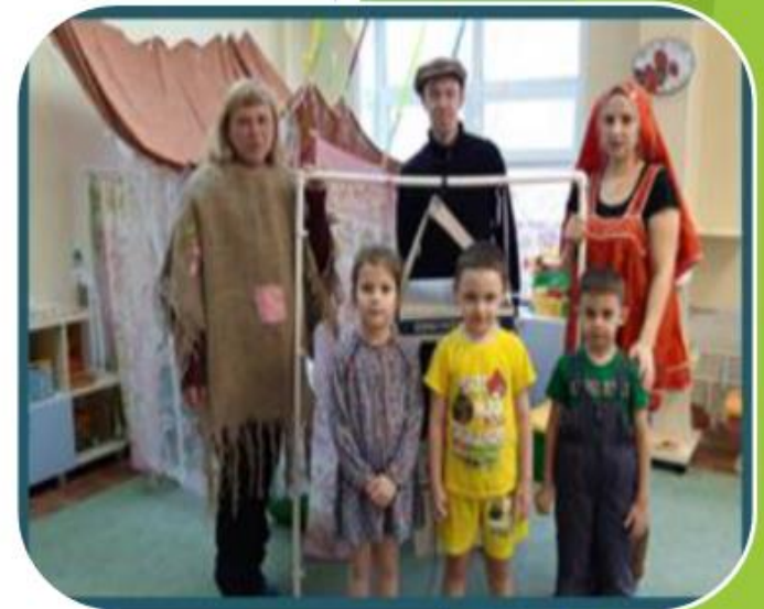
Постановка сказки «Гуси - лебеди» вместе с родителями