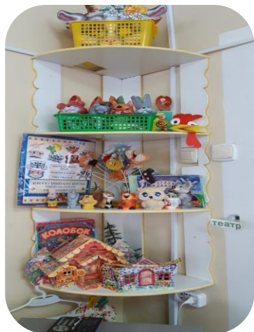
Разные виды театра