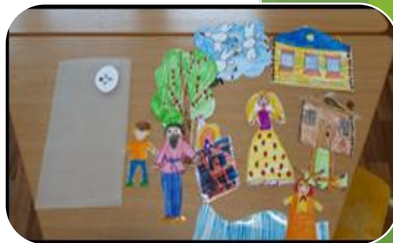
Рисуем свои сказки