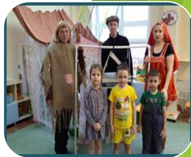
Постановка сказки «Гуси - лебеди» вместе с родителями