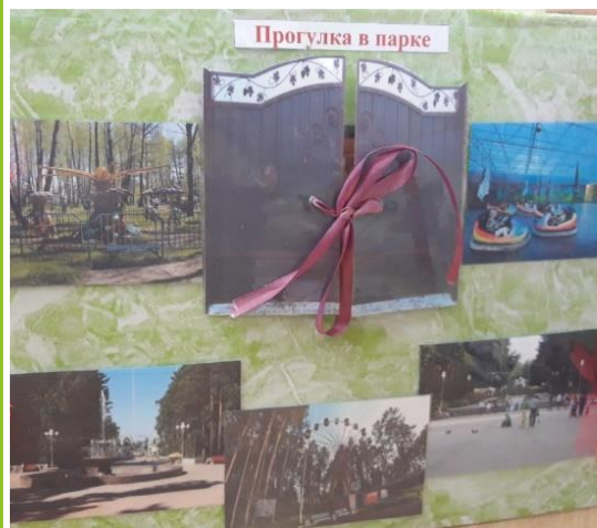
Фоторепортаж «Экскурсия по парку нашего города с посещением зоосада»