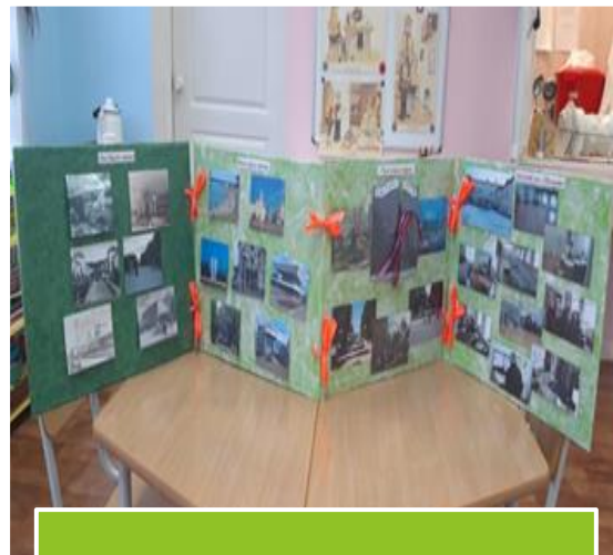
Познавательные странички города