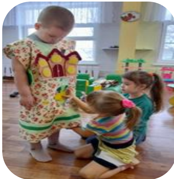
«Сказочный фартук» из фетра