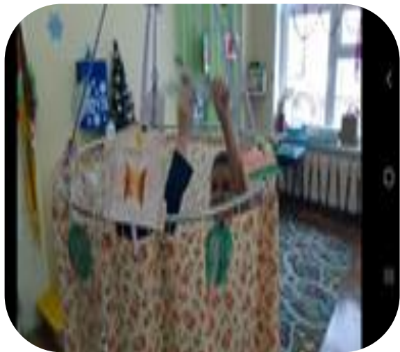
Ширма для показа сказки