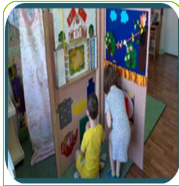
Дидактические игры на лэпбуке