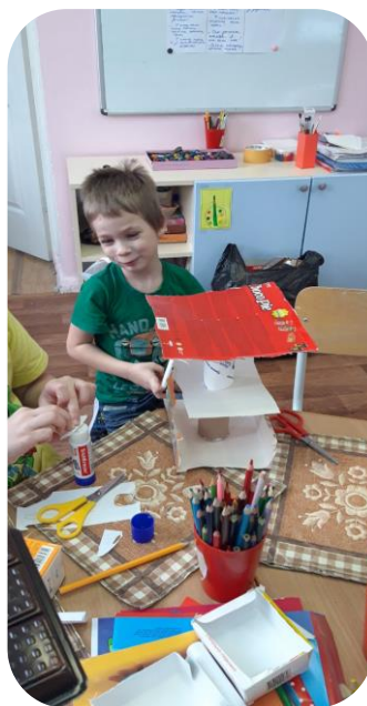
Делаем сказку из бросового материала