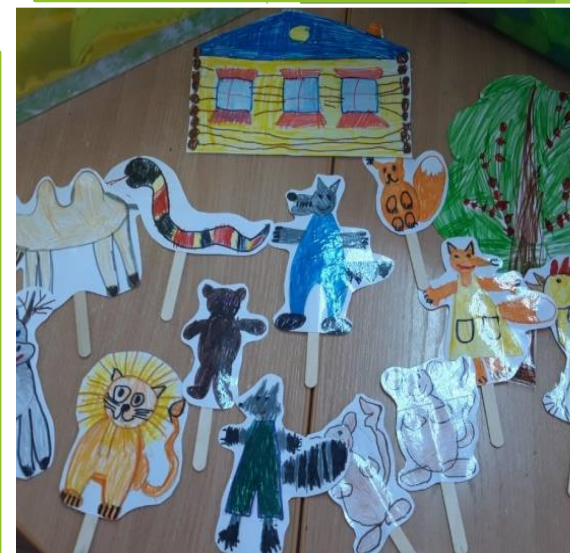
Персонажи животных для игры в театр, сделанные руками детей