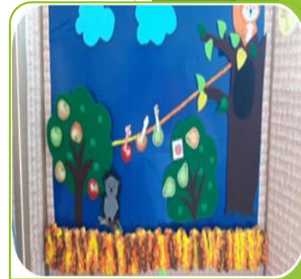
Обыгрывание сказки по собственному замыслу из фетра