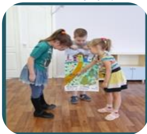
Презентация афиши к сказке