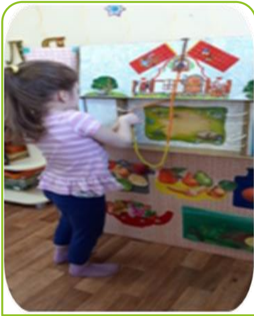
Расскажи сказку с помощью шнуровки