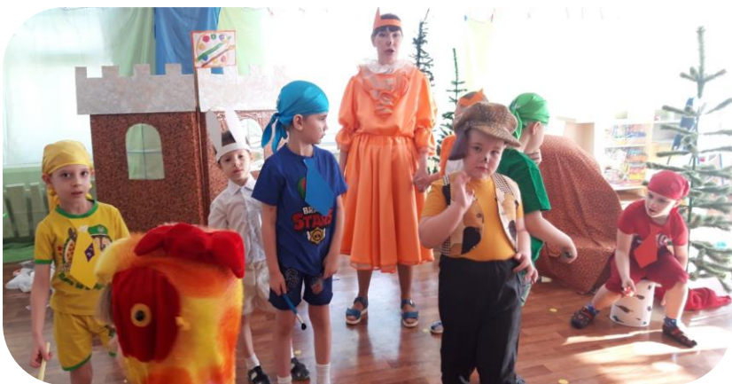
Готовимся к показу сказки «Петух и краски»