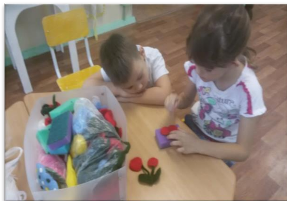
«Что за чудо ягоды!» валяние из шерсти.