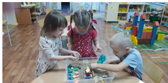
«Выросли витамины, большие- пребольшие!»