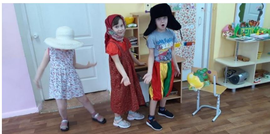
Драматизация сказки «Репка»

Развивающая предметно-пространственная среда в нашей группе насыщена разнообразием и изменяется в соответствии с тематическим планированием образовательного процесса. Она доступна детям, которые могут выбирать интересные для себя игры и занятия, чередовать их в течение дня.