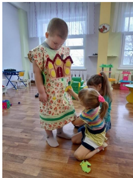
Расскажу сказку Сутеева «Яблоко»