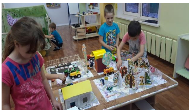
«Едем собирать урожай»

Работа по использованию макетов носит творческую (самостоятельную) и тематическую направленность. На познавательных занятиях знакомила детей с темой, затем на занятиях по ручному труду и конструированию дети создавали поделки своими руками, оформляли их на макете и выносили в самостоятельную игровую деятельность.