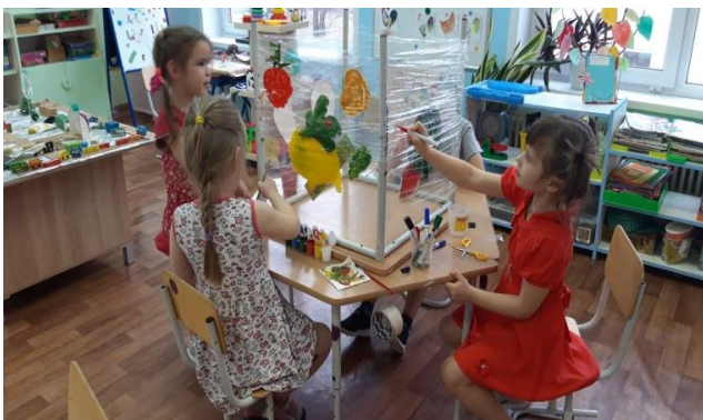
«Вкусные витаминки» рисование на пленке.