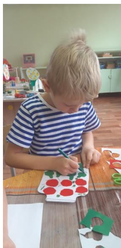
«Варенье из ягод»

Значимую роль играет процесс изготовления макетов самими детьми.