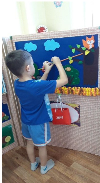
Сказка из фетра – «Фруктовый сад»