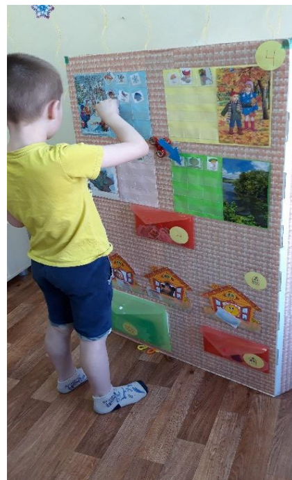
«Когда это бывает?»