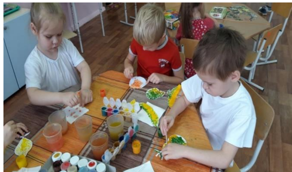
«Люблю фрукты, ягоды» рисование методом тычка.