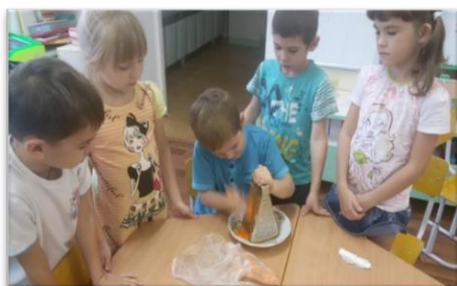
«Сейчас будет сок из фруктов»

Дети при игре в экспериментальном центре могут самостоятельно найти себе занятие. Рассмотреть объекты через лупу, микроскоп, сделать свои умозаключения.