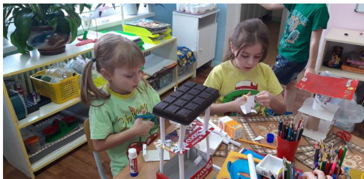
«Коробочка для фруктов и ягод»

Заводим тесто, лепим и обыгрываем поделки в свободной деятельности.