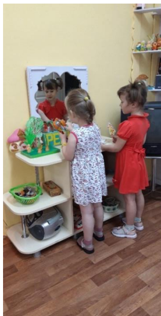
«Посадил дед репку»

Содержание театрального центра соответствует темам изучаемых сказок.