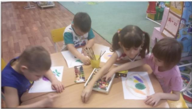
«Натюрморт» рисование пастелью.

В продуктивной деятельности использую разные методы и приемы: