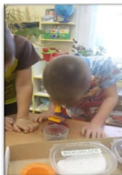
«Рассмотрю-ка я ягоду»