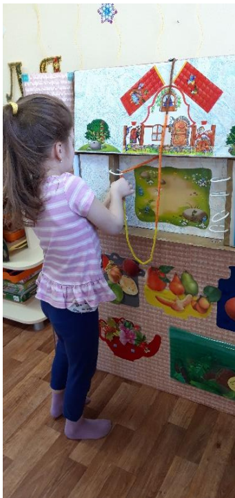
«Расскажи сказки со шнуровкой»