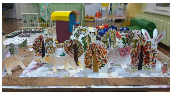
«В лес по ягоды»