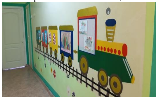
«Паровозик» - тема недели