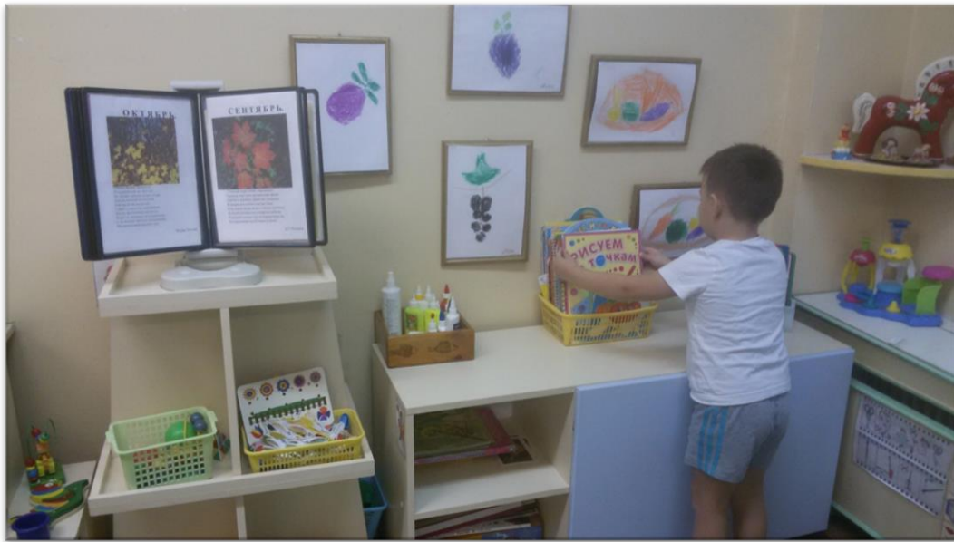
Авторская выставка ребенка «Что за чудо витамины?»

В продуктивной деятельности использую разные методы и приемы: