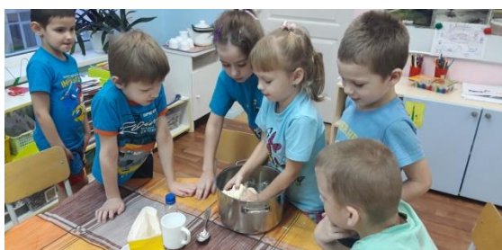
«Вот так тесто получилось!»

Заводим тесто, лепим и обыгрываем поделки в свободной деятельности.