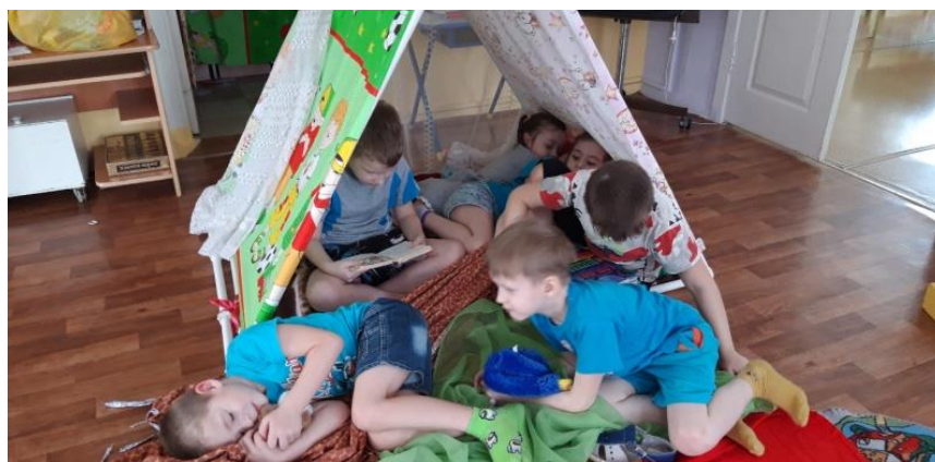
«Собрали ягоды в лесу, устали, поели, теперь надо отдохнуть»