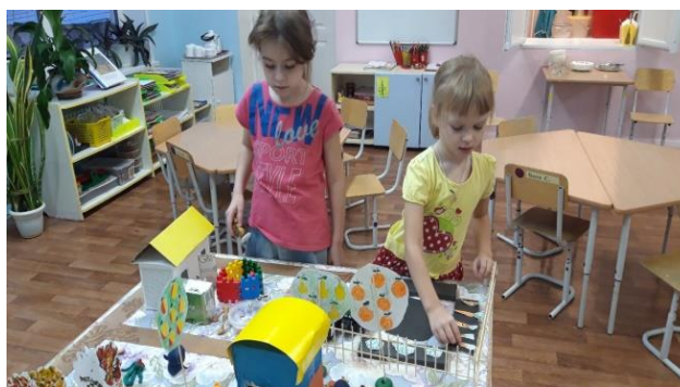
«Ах! Как выросли витамины!»