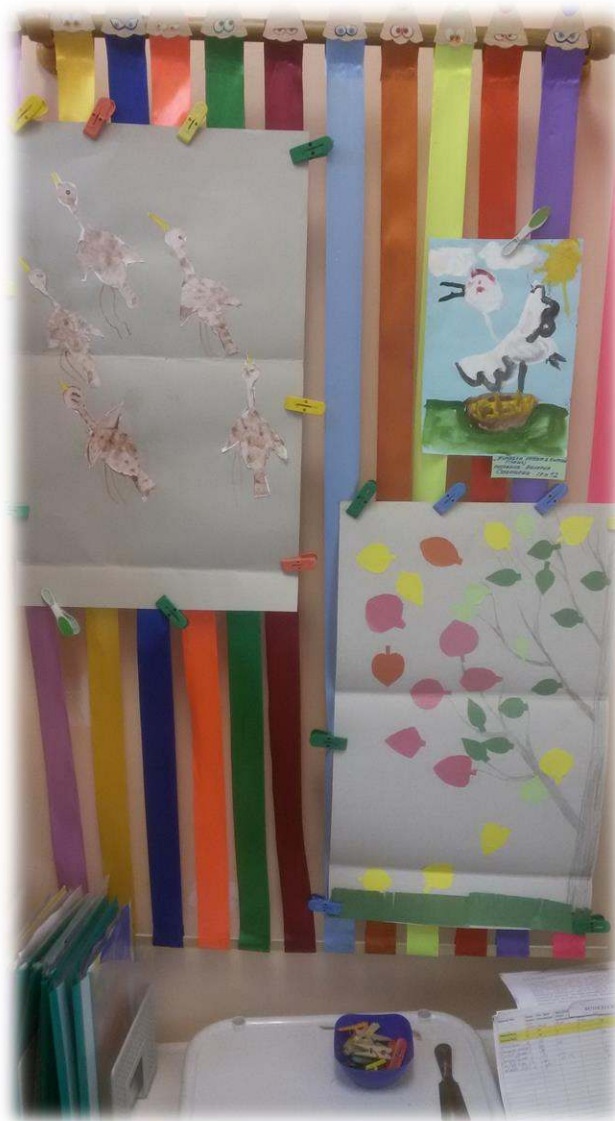
Выставка детских работ по теме недели «Что за чудо – эта птичка?»