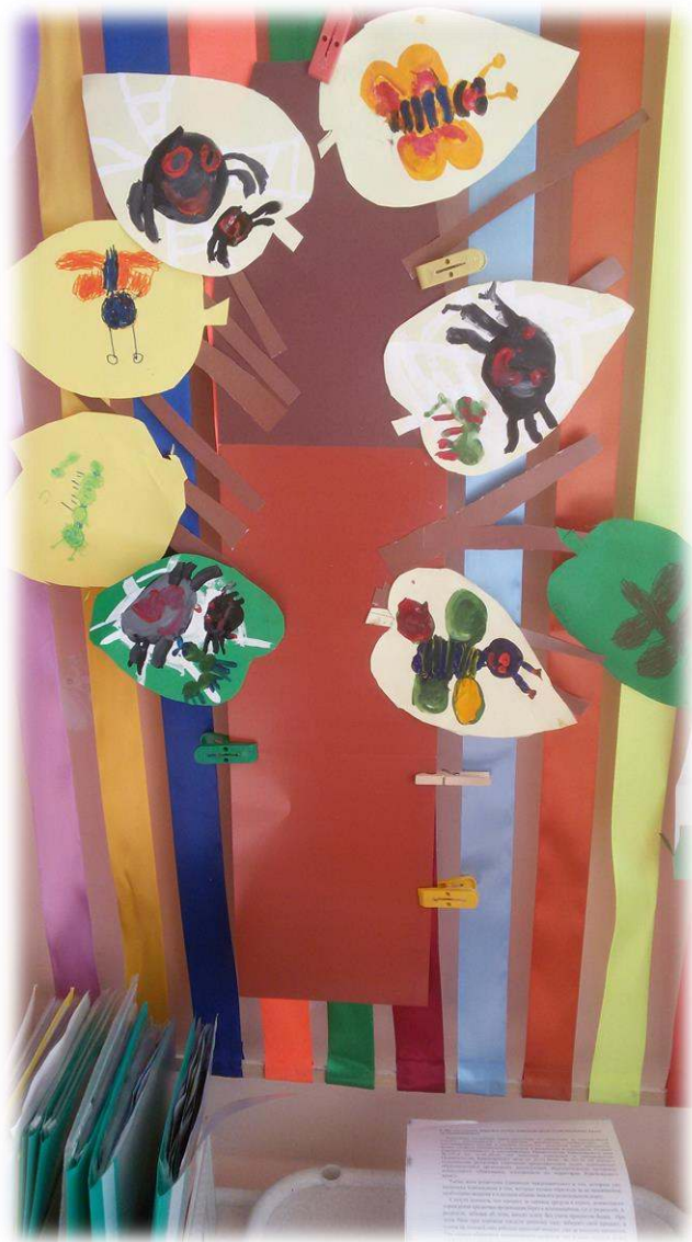
Выставка детских работ по теме недели «Наши друзья насекомые»