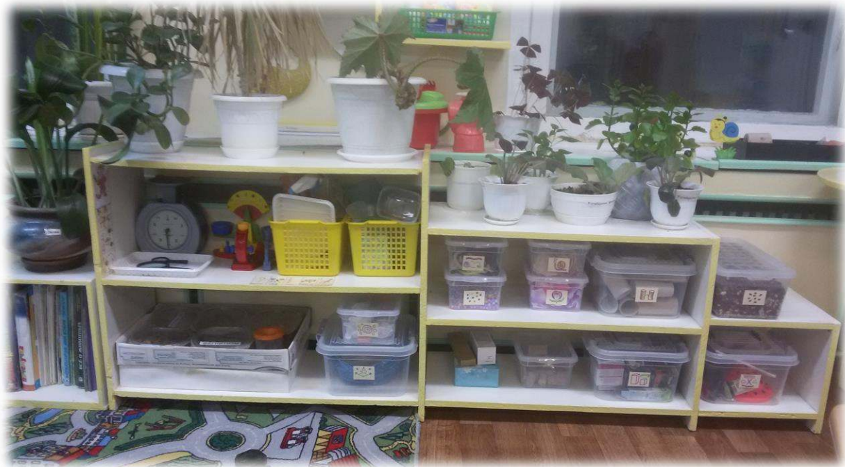
Правила работы в центре