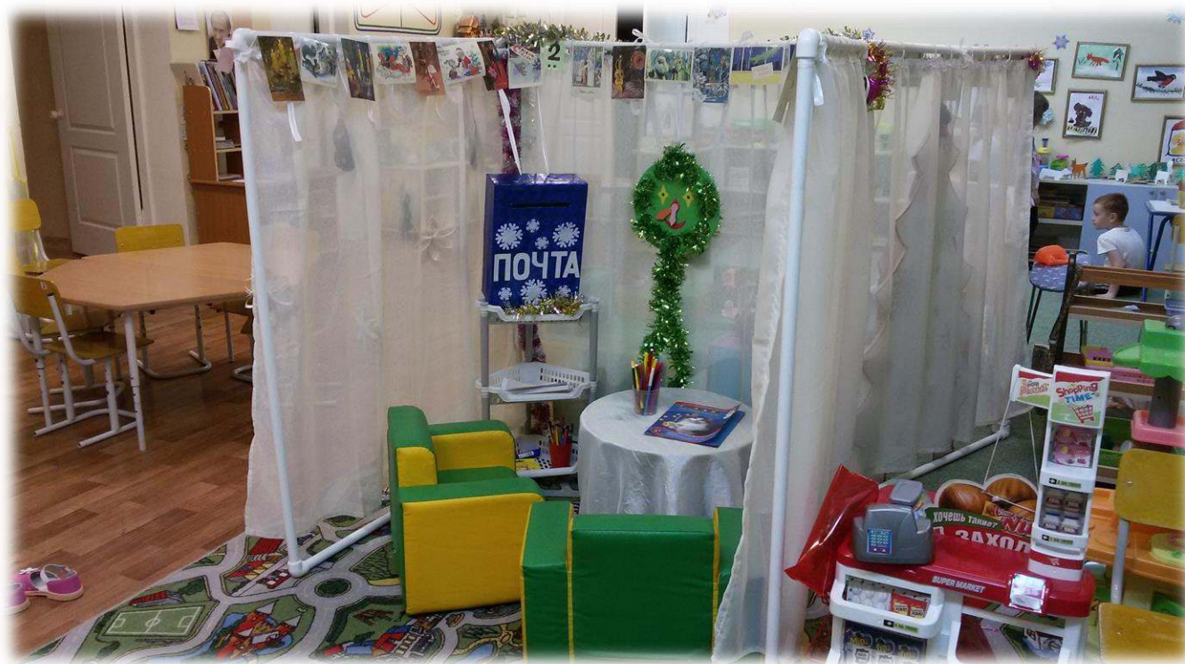
«Мастерская деда Мороза»