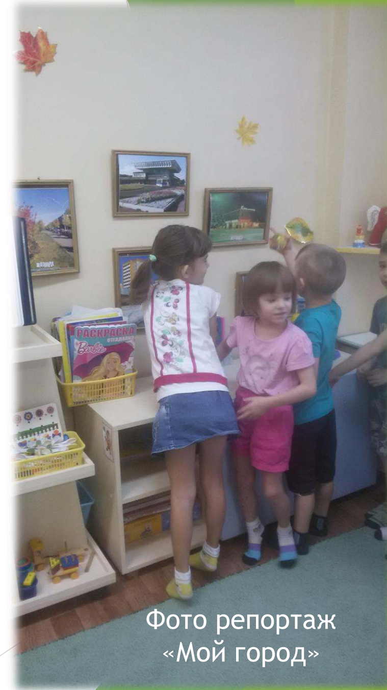
Фото репортаж «Мой город»