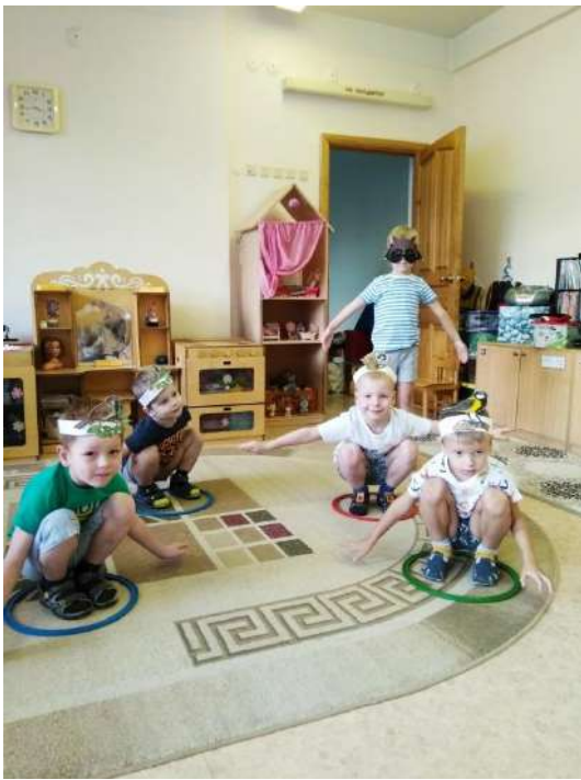
Подвижные игры с атрибутами (шапочки для птиц).