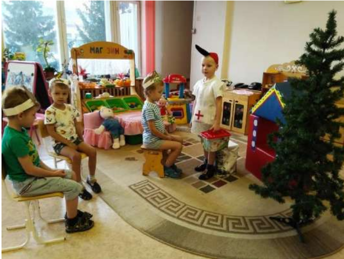
Сюжетно – ролевая игра «Лесной доктор»