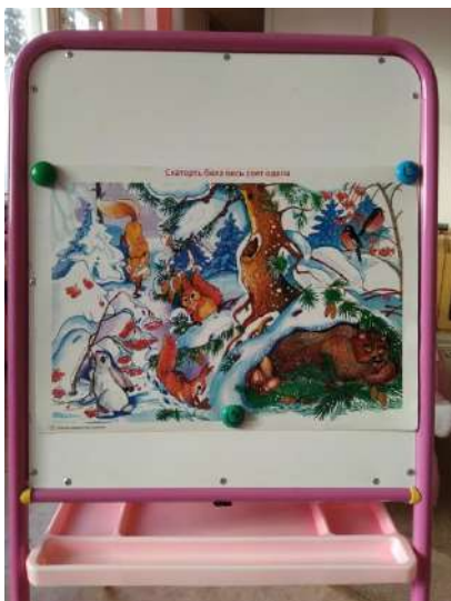
Рассмотрели картину о зиме