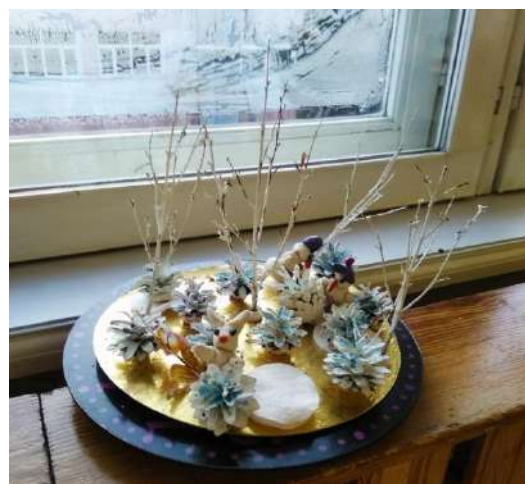
Изготовили зимний макет.