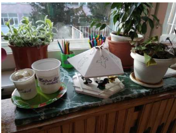
В центр экологии внесли кормушку и разные виды корма.