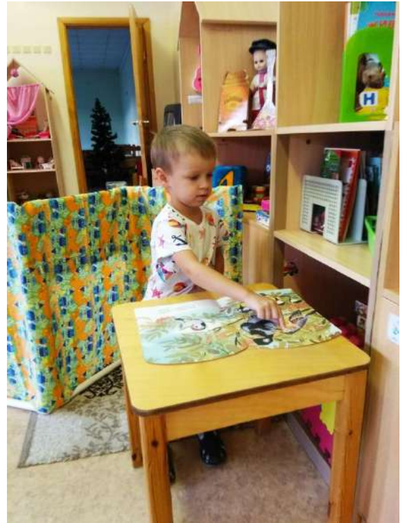
Рассматривание иллюстраций книг.