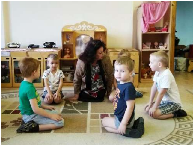
Утренний круг. Беседа о зиме. О животных зимой.