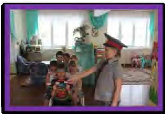
Сюжетно-ролевая игра «На дороге»

трансформируемости: в предметной среде заложила возможность изменений, позволяющих, по ситуации, вынести на первый план ту или иную функцию пространства. Так, например, при организации коллективных сюжетных игр, требующих большого пространства, игровое место организуется за счет центра физической активности и передвижения детской мебели. Атрибуты для сюжетно-ролевых игр поместила в коробки с маркером, обозначающим игру, что позволяет воспитанникам легко перенести коробку и развернуть игру в любой точке группы.