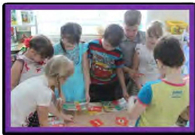
Подборка дидактических игр