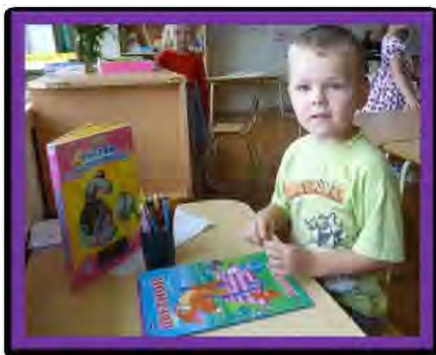
В группе выделено место для самостоятельного творчества детей.